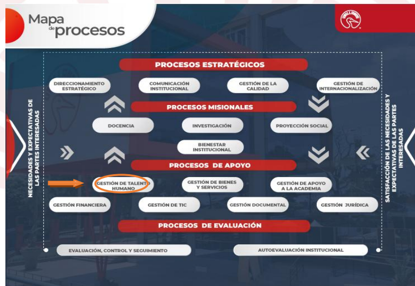
Ilustración 1 Mapa de procesos SIG Unillanos

Documentación asociada a la División de Servicios Administrativos. (PD-procedimientos; FO-Formatos; GU Guía)