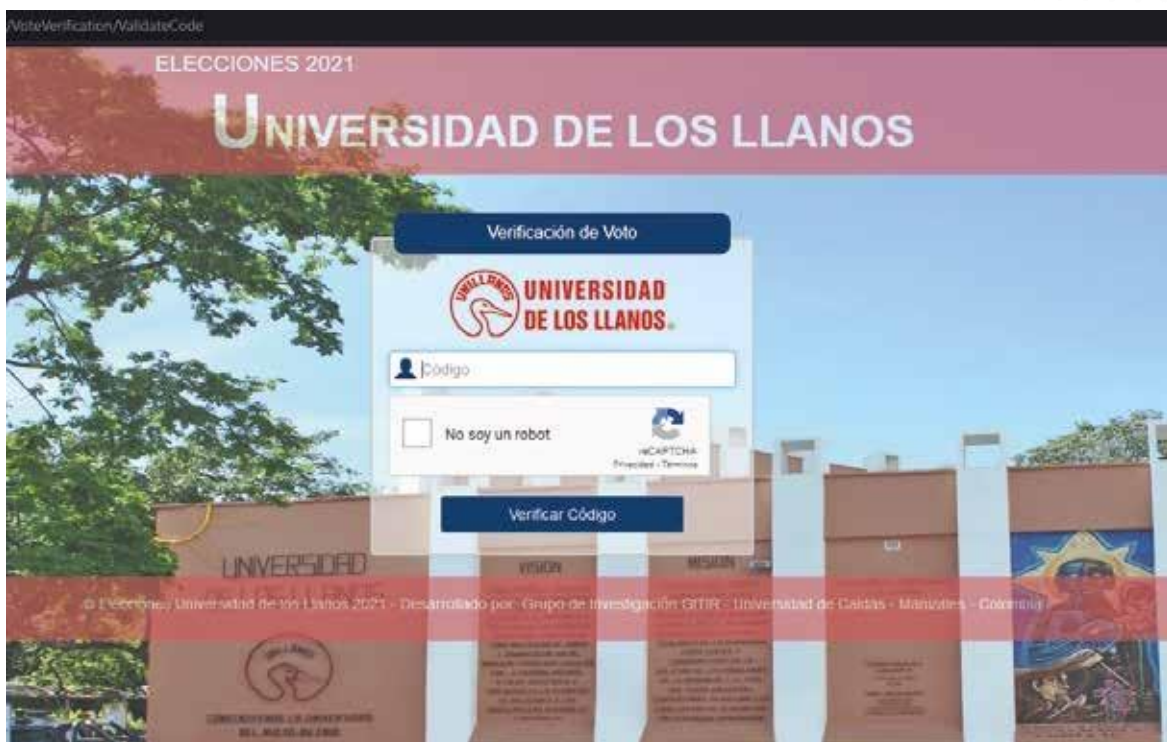
Figura 8 – Validación del código único de verificación del voto electrónico.

Durante el proceso de registro del voto electrónico, se notifica que se envía un correo electrónico con un código único de verificación. Este código puede ser usado por el votante para validar que su voto es correcto. (ver figura 8)