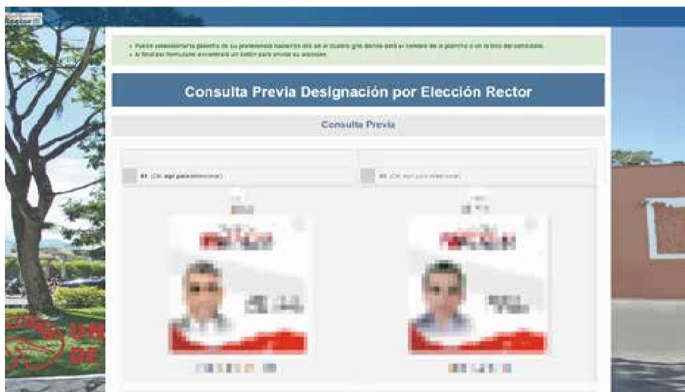
Figura 5 – Tarjetones electorales que se muestran al votante cuando inicia sesión.