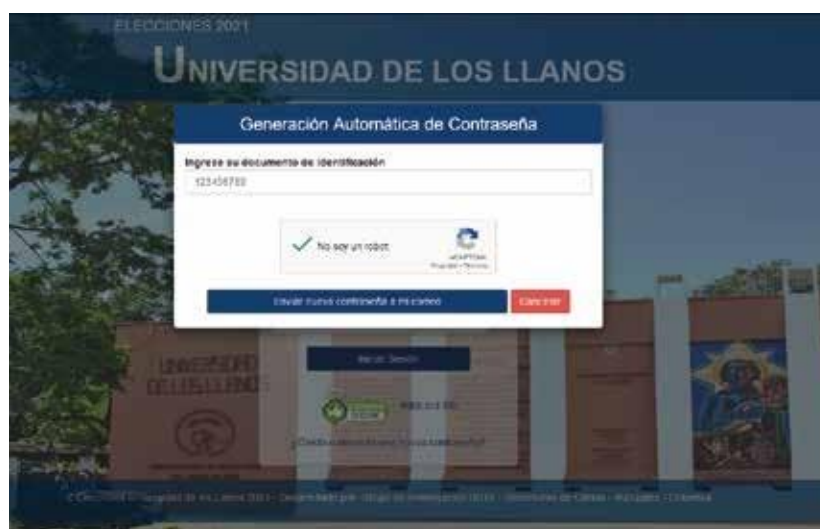
Figura 4 – Formulario de recuperación de contraseña con datos ingresados y validación de robot.