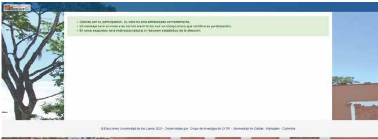
Figura 6 – Selección de candidatos en el tarjetón.

Se debe seleccionar el candidato de preferencia haciendo clic sobre la foto o sobre la barra donde aparece el número del candidato. Al hacer clic, se mostrará un recuadro verde que simboliza la selección de dicho candidato (Ver Figura 6).