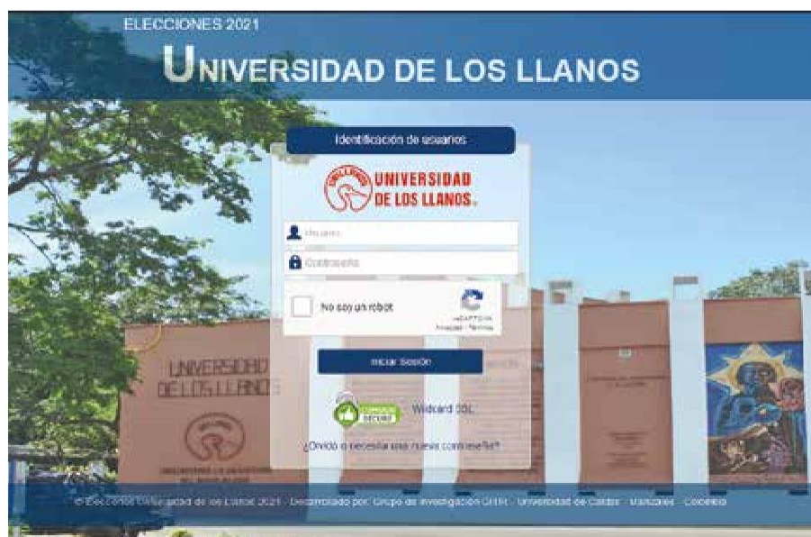
Figura 1 – Formulario de identificación del votante.

Cuando una persona ingresa al dominio principal, se encuentra con la interfaz gráfica que se muestra en la Figura 1.