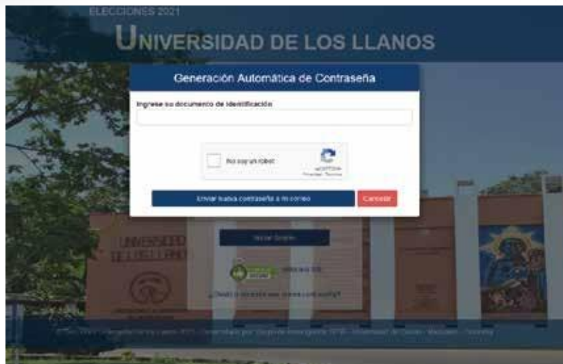
Figura 3 – Formulario de recuperación de contraseña.