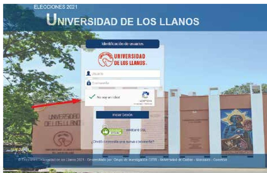
Figura 2 – Formulario de identificación del votante con datos ingresados y validación de robot.

El formulario anterior deberá ser diligenciado por la persona; deberá validarse como persona haciendo clic en el cuadro gris del recaptcha.