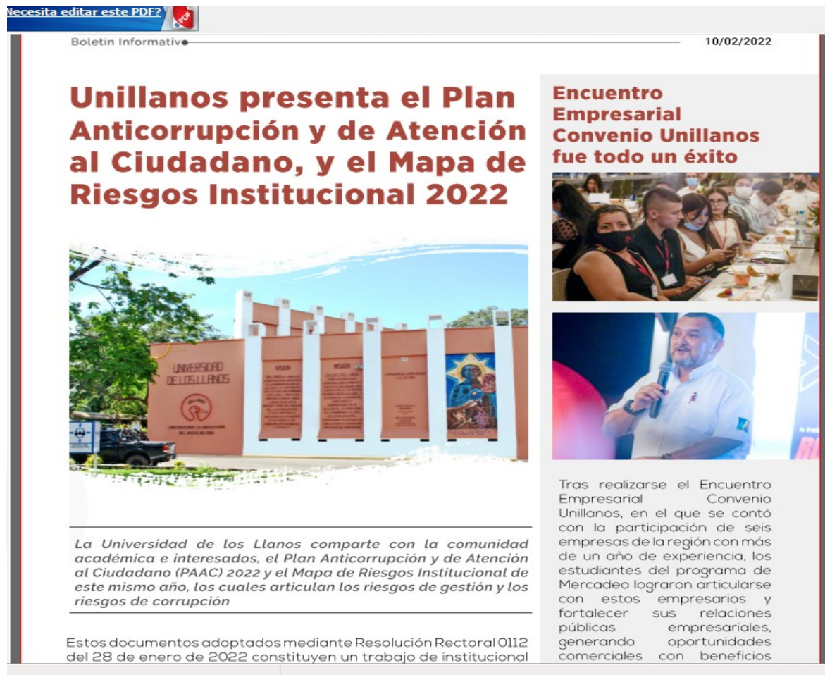
Figura 7. Publicación en el boletín de la Universidad de la última versión del PAAC-2022.

La versión final se encuentra publicada en la página de la Universidad en el link de transparencia: https://www.unillanos.edu.co/docus/PAAC-2022F.pdf