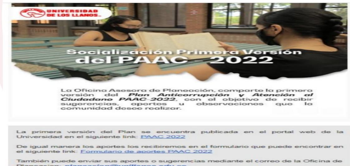
Figura 5. Publicación primera versión PAAC-2022.

Una vez surtido el proceso de participación ciudadana y teniendo en cuenta la viabilidad de las observaciones hechas por las comunidades que participaron en la construcción del PAAC-2022, se procedió a integrar algunas de ellas dentro de las actividades.